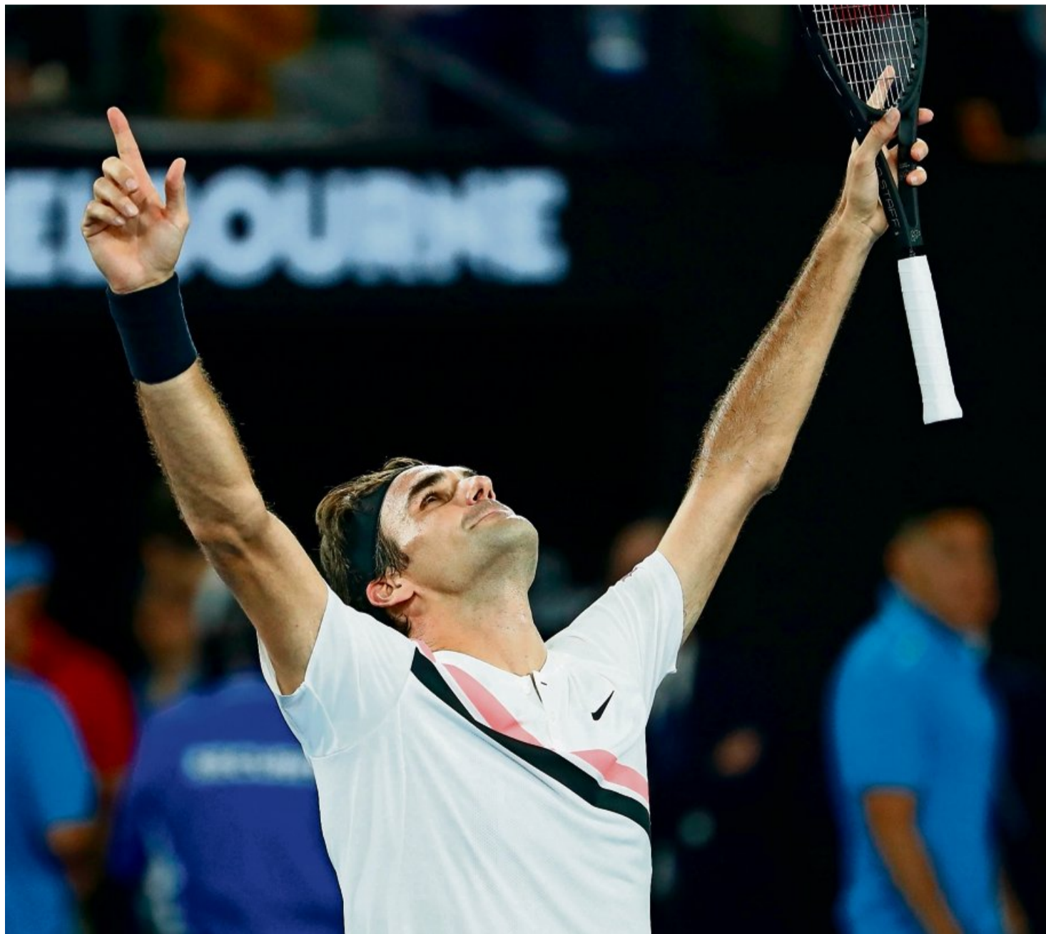
Der Moment des Triumphs: Roger Federer nach seinem Finalsieg über den Kroaten Marin Cilic am Australian Open in Melbourne.